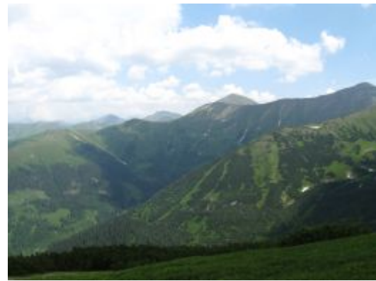
Panorama Tatr z Rakonia