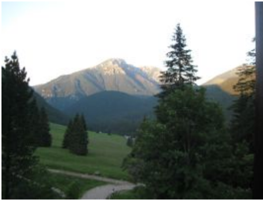
Widok z okna Schroniska