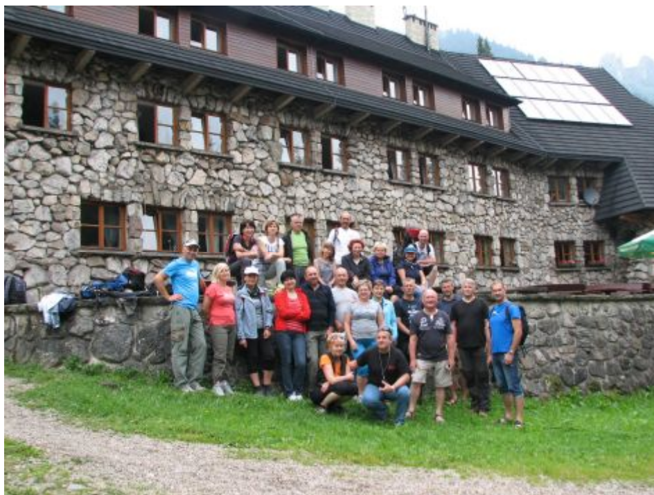
Grupa „taterników” tuż przed wyjazdem do domu... (odjazd rowerami do wylotu Doliny Chochołowskiej)

rzadko podobne, dobrze zorganizowane grupy się zdarzają, którym chce się po dużym, wielogodzinnym wysiłku, spotkać się jeszcze wieczorem by pośpiewać.