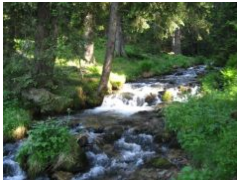
Strumień na „Szlaku papieskim”